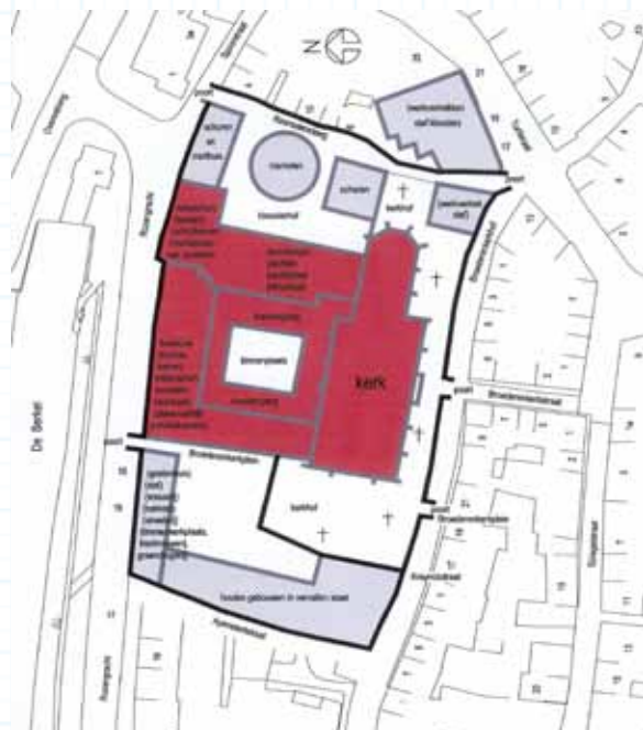
Plattegrond van het gebouwencomplex van het Stedelijk Museum Zutphen.

Sloophamer, schatkamer, een project van Ida van der Lee uit 2003-2006 dat een levend maar verdwijnend stukje samenleving naar het museum bracht.