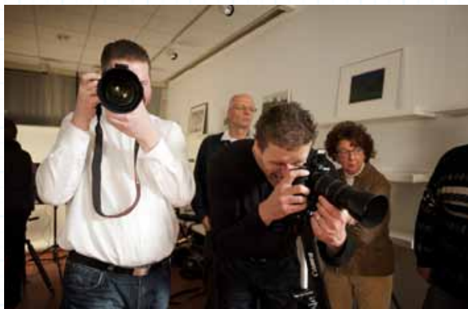
Tentoonstelling De Wonderkamer van Zoetermeer , 2009.