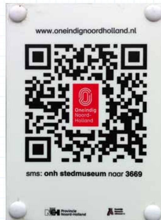
Een QR-code bij de ingang van het museum.