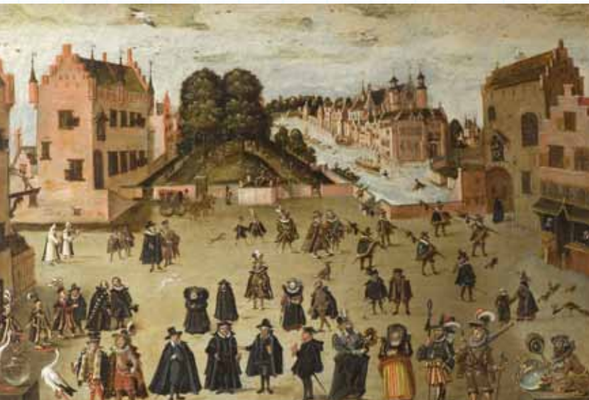
Kunstenaar onbekend, De Plaats met de Gevangenpoort en het Groene Zoodje, 1597.