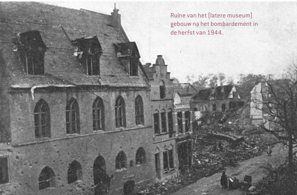
Ruïne van het (latere museum) gebouw na het bombardement in de herfst van 1944.