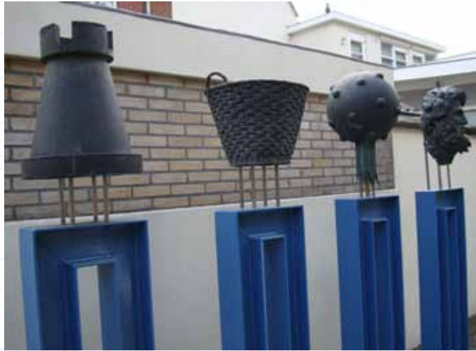
Nicolas Dings, Mnemosyne , 1996. Herinneringen aan het kasteel, de mandenmakerij, de fruitteelt en het water.