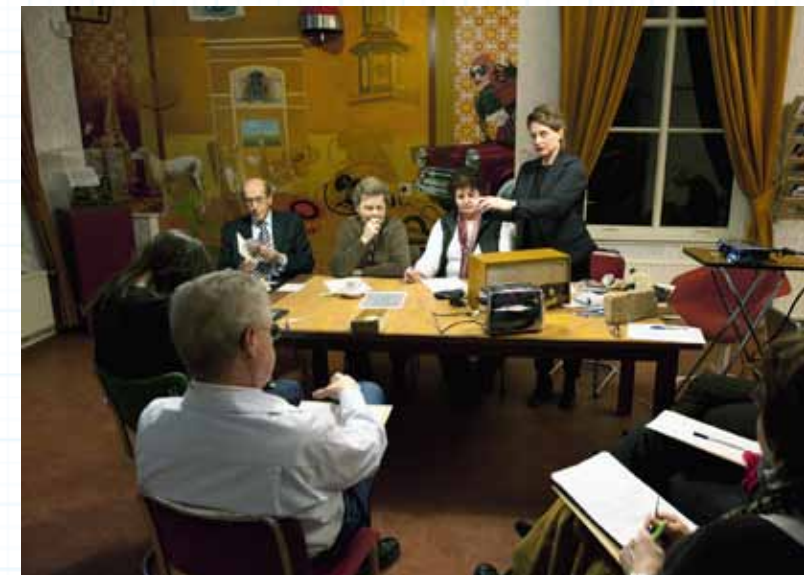
Participatie tijdens De Wonderkamer van Zoetermeer , 2009.