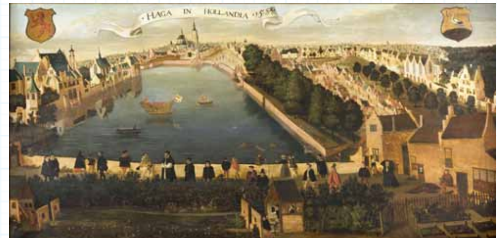
Hollandse School, De Hofvijver gezien vanaf het Doelenterrein , 1553, Haags Historisch Museum.