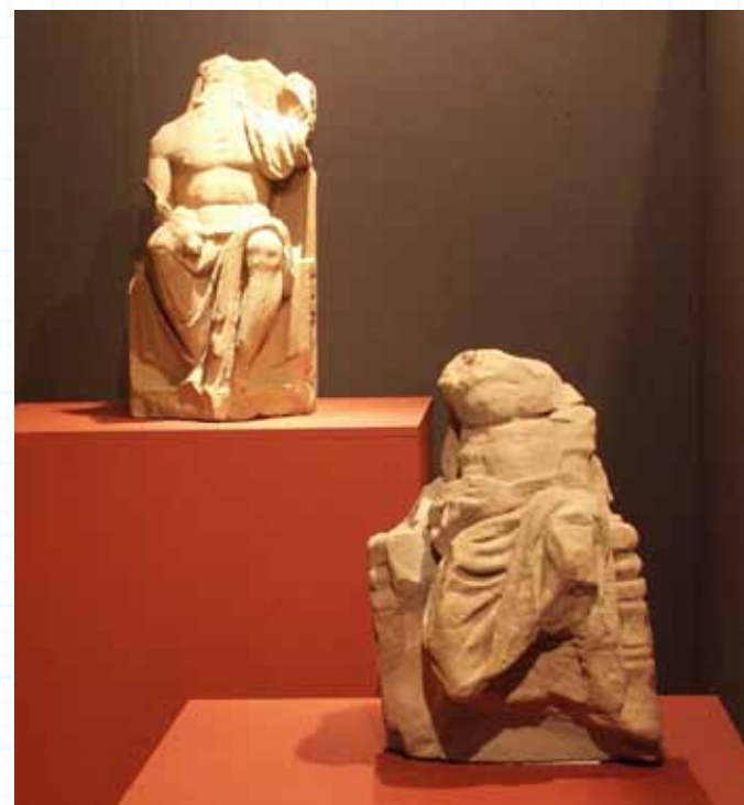
Fragmenten van twee Romeinse Jupiterbeelden gevonden in Grevenbicht, onderdeel van de vaste presentatie, afdeling Stedelijke Historie, Museum Het Domein, Sittard.

Het stadsmuseum is dus een museum met heel diverse verzamelingen, die worden bestudeerd en geïnterpreteerd door uiteenlopende wetenschappelijke disciplines, tegenwoordig