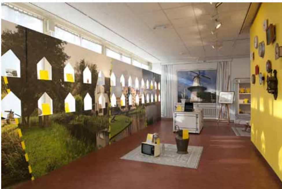
Tentoonstelling Give & Take , Stadsmuseum Zoetermeer, 2008.