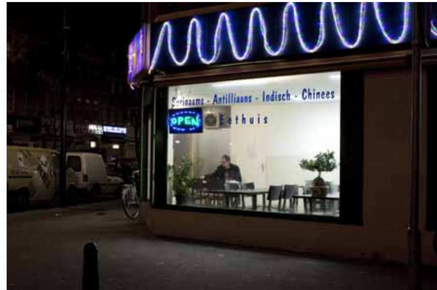
's Nachts op pad om snackend Rotterdam vast te leggen. Museum Rotterdam.

Je zou kunnen zeggen dat bewoners het immaterieel kapitaal zijn van de stad. En daarom is het betrekken van die bewoners bij het stadsmuseum van het grootste belang. Participatie dus, een vorm van museaal werken die overigens niet beperkt blijft tot stadsmusea. Deze trend is een algemeen maatschappelijk verschijnsel, en doet zich ook in andere musea voor. Maar voor stadsmusea heeft de participatie van bewoners in de activiteiten van het museum, zoals evenementen, tentoonstellingen, educatieve activiteiten, maar ook het verzamelen van de eigen tijd, een extra betekenis. In het hoofdstuk Participerend verzamelen doen verschillende musea enthousiast verslag van hun aanpak op dit terrein. Het versterkt de verbinding tussen bewoners en hun leefomgeving, op kleine schaal, maar ook op de grotere schaal van de stad. Daarmee heeft een stadsmuseum voor de stad een schat in handen: het kan een platform zijn voor stad en stedelingen, het kan verbinding tussen stedelingen bevorderen.