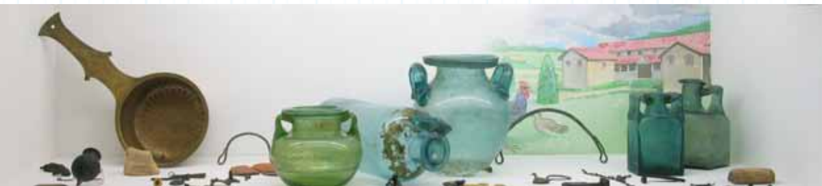
Vitrine met Romeinse grafvondsten afkomstig uit Buchten en Geleen, onderdeel van de vaste presentatie, afdeling Stedelijke Historie, Museum Het Domein, Sittard.