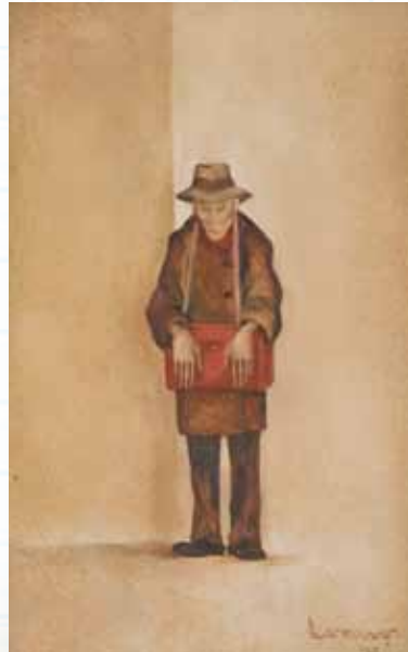
12 L. Landzaat, Pindaman. Chinese venter van lekkernijen , 1938, Haags Historisch Museum.

Jan van Goyen, Gezicht op 's-Gravenhage vanuit het Zuid-Oosten , 1650, Haags Historisch Museum.