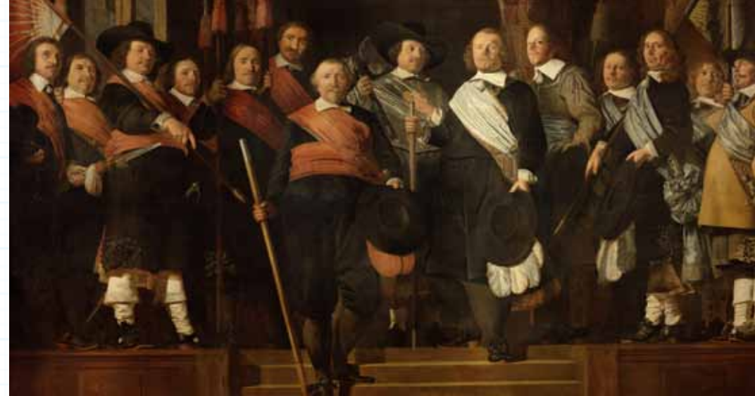
Caesar van Everdingen, Officieren en vaandeldragers van de Oude Schutterij , 1657, Stedelijk Museum Alkmaar.