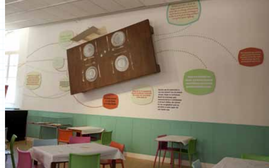
Typisch Toon , een tentoonstelling over multitalent Toon Hermans met een integrale presentatie van schilderijen, conferencefragmenten en objecten, 2010.

'We geven in onze tentoonstellingen ook altijd veel informatie. Wat is er trouwens mis met een ervaring? We proberen mensen een spiegel voor te houden: je voorouders waren niet zo veel anders dan jij. Daar steken ze echt wel wat van op.'