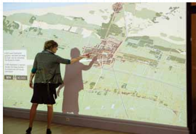
Museale presentatie van de groeikaart van Den Haag, Haags Historisch Museum.

'Wij vinden dat niet nodig. Deels uit praktische overwegingen. Als wij het Haags Museum gaan heten ontstaat er een spraakverwarring met het Haags Gemeentemuseum. Maar ook inhoudelijk. In Amsterdam en Rotterdam heeft men meer behoefte het verleden vanuit het heden te ontsluiten. Wij merken dat hier in Den Haag publiek is voor dat historische aspect – en dan heb ik het