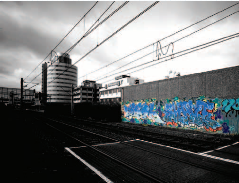
Zoetermeer, een nieuwe stad, 2006.

Als er iets hot is in de erfgoedwereld is het wel 'participierend verzamelen'. Dat geldt zeker voor stadsmusea die het moeten hebben van een nauwe band met de lokale bevolking. Door heel Nederland heen zijn inmiddels voorbeelden van succesvolle projecten waarbij het museum de wijk in is getrokken en samen met bewoners een waardevolle verzameling heeft aangelegd.