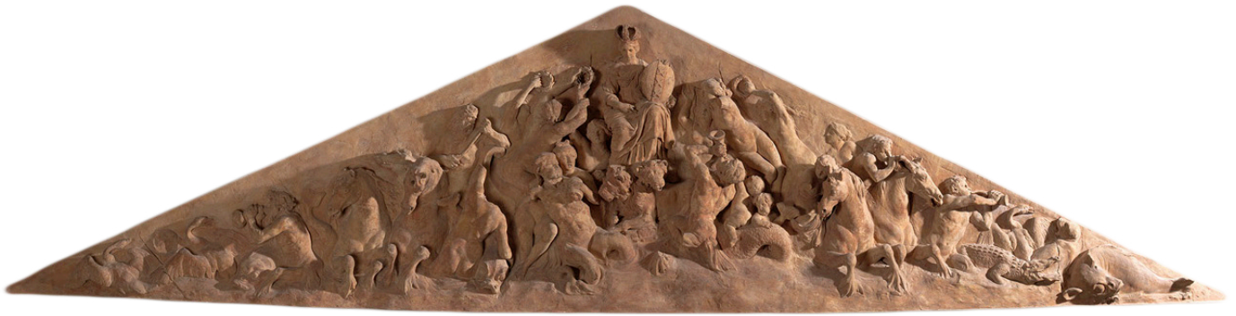
Timpaan van de achtergevel van het stadhuis, prent door Quellinus, ca. 1665-1668.