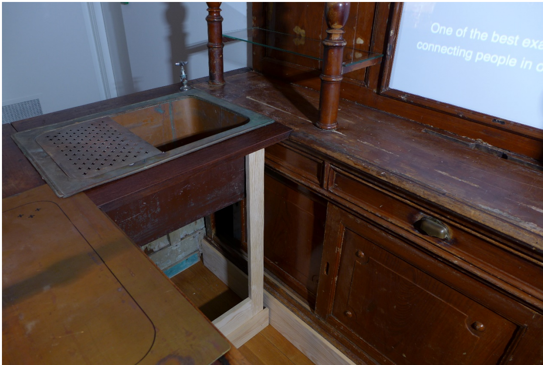
Afb. 10 Linker lade achter spoelbak