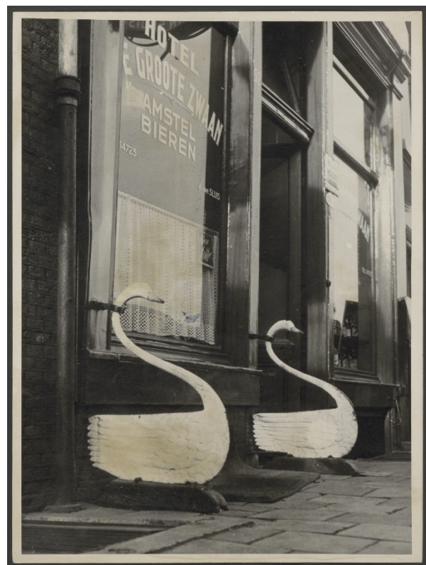
Afb. 1 Prins Hendrikkade 52 april 1955