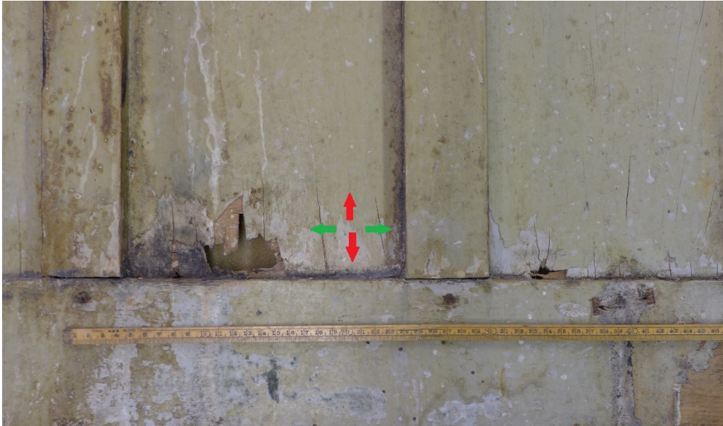
Afb. 9 Detail lambriseringpaneel toog. De schade rond het gat toont de verschillende kruislings verlijmde lagen van het triplex

Triplex plaatmateriaal kwam in Nederland pas in de eerste decennia van de 20 ste eeuw in de handel en dit zou betekenen dat de toog en overige betimmering later zijn dan buffet. De manier waarop de toog aan het buffet is gekoppeld is daar ook een aanwijzing voor. Waar de spoelbak in de korte zijde van de toog is geplaatst, blokkeert zij de linkerlade van het buffet. Niet echt een logische constructiemethode wanneer buffet en toog op hetzelfde moment gebouwd zouden zijn geweest! 3