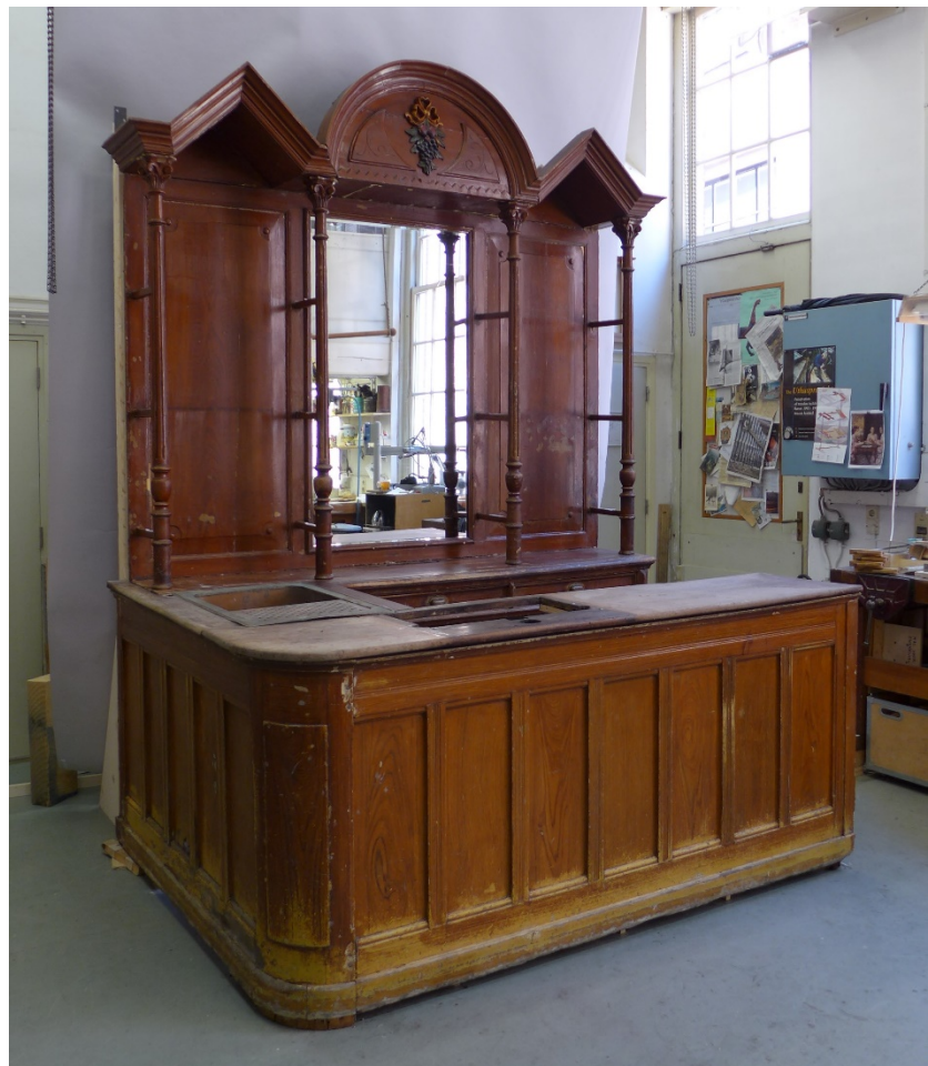
Afb. 15 Totaal, na restauratie, in de restauratiewerkplaats

Al met al een interieur dat het nodige te vertellen heeft. En we hopen natuurlijk nog op spannende verhalen van de vroegere stamgasten!