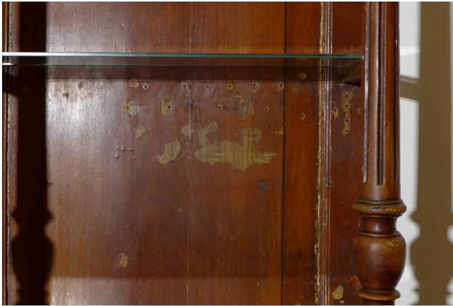
Afb. 14 Detail rechter benedenhoek achterschot buffetkast.

Volgens mij hebben hier de sleutels gehangen van de hotelkamers.