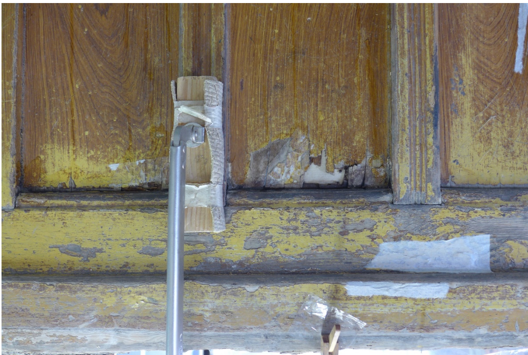
Afb. 4 Grondkleur zonder houtnerf onderaan de lambrisering van de toog

In de collectieregistratie wordt het interieur wel 'een bruin café' genoemd, en inderdaad; wat direct opvalt is de bruine houtnerfimitatie waarmee het overal beschilderd is. Ten tweede - misschien is dat ook typisch voor een bruin café - hoe sleets die beschildering op veel plaatsen is. De reden voor die slechte conditie is deels technisch; de opgeschilderde houtnerf bestaat uit een zeer dunne saus die in patronen wordt aangebracht op een gelige grondkleur. Hoewel er daarna nog een vernis over werd aangebracht, blijft zo'n dunne afwerklaag natuurlijk kwetsbaar voor slijtage. En is de toplaag met de nerftekening een keer weg, dan blijft alleen de grondkleur over.