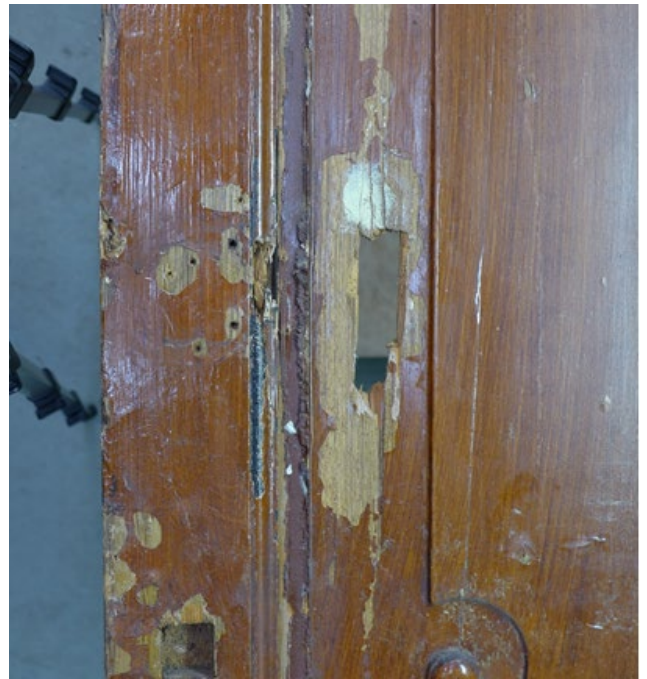
Afb. 5 Forse slijtage onderaan de kolommetjes, rechts wordt zelfs het kale hout zichtbaar.