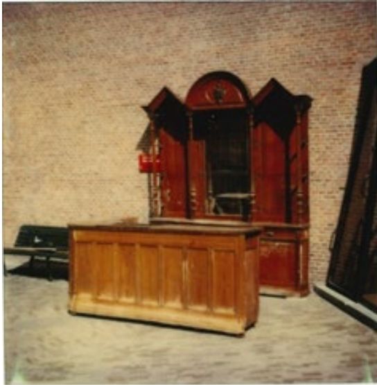
Afb. 3 Het pas verworven Groote Zwaan interieur voor één dag opgebouwd op de museum kinderbinnenplaats, 1981.

Dit heeft sterk bepaald hoe we het tonen en hoe het gerestaureerd is. We streven in de opstelling van toog en buffet niet naar onbeschadigd en compleet, maar laten weg wat verdwenen is en beperkten ons tot schoonmaken en stabiliseren waar dat vereist is. Een uitzondering vormt de biertap, die gevonden is op Marktplaats, want ja, wat is immers een toog zonder tap.