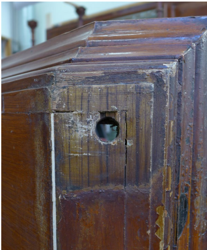
Afb. 7 Detail onderzijde kap van buffet. De eerste houtimitatie werd voor assemblage van de buffetkast aangebracht, de tweede houtimitatie zonder het meubel uiteen te nemen. Hierdoor zit tussen de kap en de kolomkapitelen alleen de eerste houtimitatie.