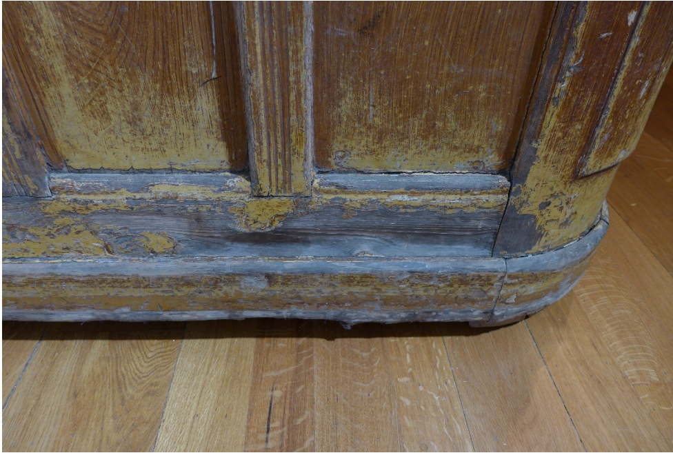
Afb. 12 Kuil in toog lambrisering

Het jarenlange dweilen van de vloer had schimmel veroorzaakt in de plint van de toog, daar kwam vervolgens houtworm op af, waardoor de onderrand er nu nogal aangevreten uitziet.