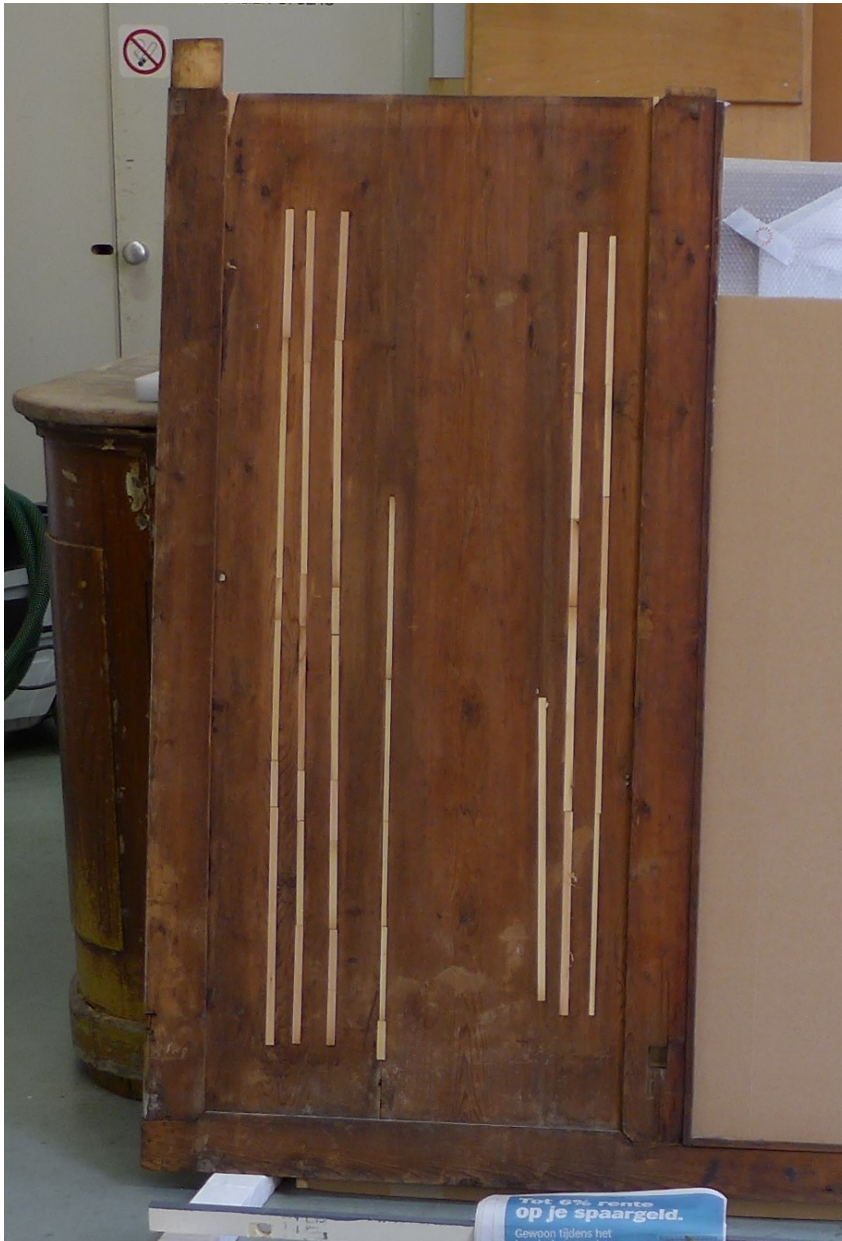
Afb. 8 Detail achterschotpaneel buffetkast, achterzijde tijdens restauratie. Om het kromgetrokken massief houten paneel te kunnen vlakken zijn strips nieuw hout ingelegd.

Opvallend is nu dat het 'noten' als eerste beschildering alleen op het buffet voorkomt. Op alle overige onderdelen ontbreekt ze. En er zijn meer aspecten waarin het buffet verschilt van de overige betimmering en toog. Zo zijn de panelen in het buffet nog heel traditioneel van massief hout vervaardigd terwijl ze bij de latere onderdelen van triplex zijn.